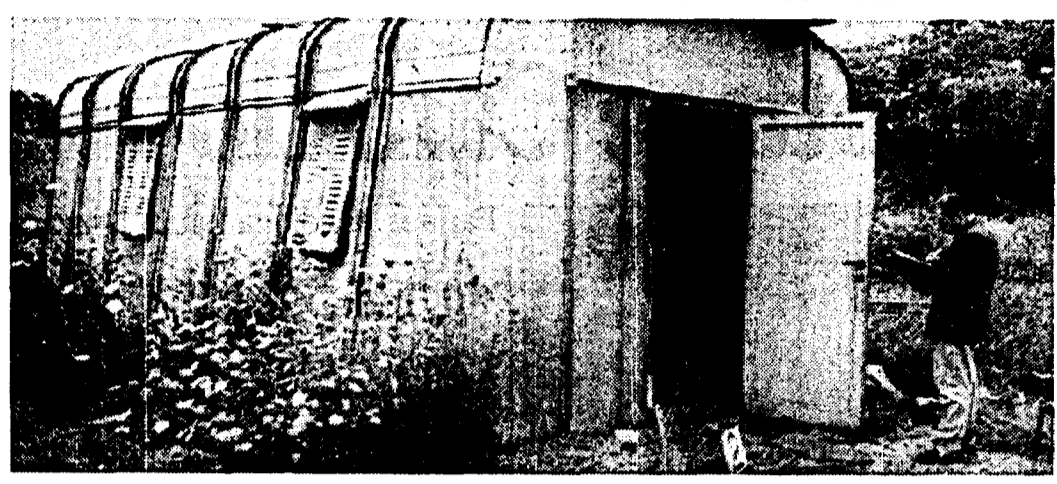
Il surrogato dove è stata ritrovata la donna sevizata e uccisa, sulla Flaminia vecchia

La vittima ancora senza nome Ricerca dai carabinieri il custode dell'ex cantiere per far luce sul delitto