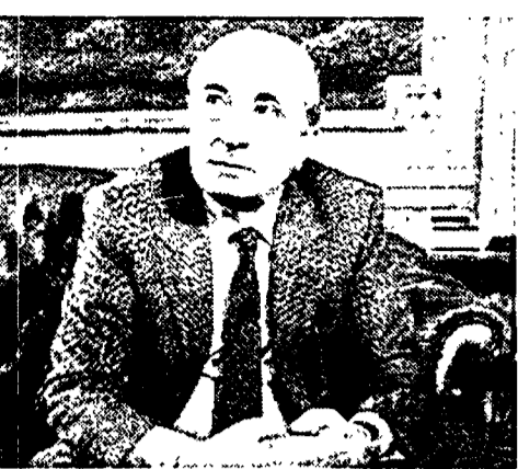
Ciriaco De Mita