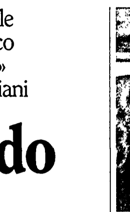
Ciriaco De Mita

GENOVA. Dopo Leoluca Orlando a Palermo con le sue 70 mila preferenze, era stato il candidato sindaco democristiano più votato nelle amministrative di maggio: 30 mila preferenze.