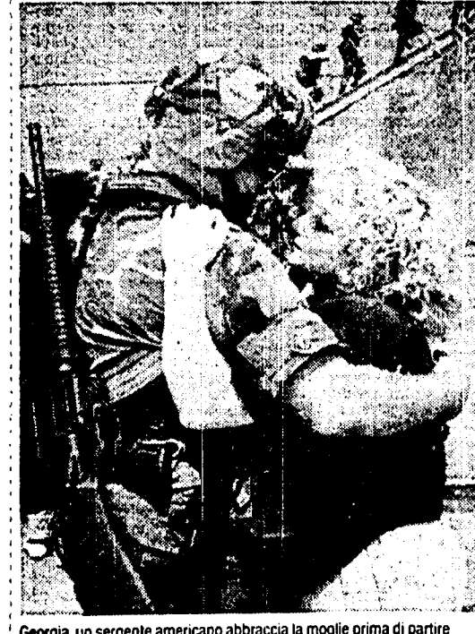
Georgia, un sergente americano abbraccia la moglie prima di partire

«Blame it on the Rain» (È colpa di lui, il piovoso), «Blame it on the Rain» (È colpa di lui, il piovoso) di Milli Vanilli.