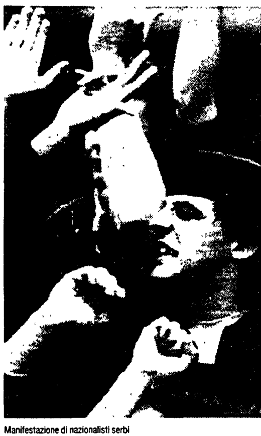
Manifestazione di nazionalisti serbi

I 500mila serbi della Croazia da ieri hanno comin- ciato ad andare alle urne. Hanno tempo fino al 2 settembre per dire se vogliono una forma di autogov- erno. Il governo di Zagabria segue con apprensione lo svolgimento del referendum, mentre a Belgrado Slobodan Milosevic continua a tacere. Non si hanno notizie di incidenti. Il ruolo delle forze arma- te per impedire la disgregazione dello Stato.