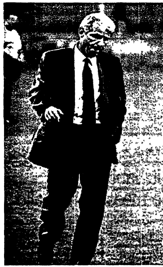
Giovanni Trapattoni non è ancora convinto dalla sua Inter

non di una campagna acquisti errata. Quest'anno abbiamo preso Fontolan e un ragazzo che avrebbero voluto molte società e che ha avuto la sola sfortuna di infortunarsi molto gravemente.