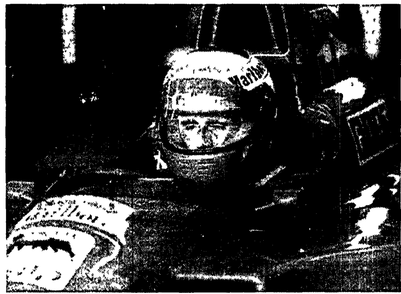
Alain Prost da oggi a Monza per le prove del Gran premio del 9 settembre

Jim Clark, sopravanzando niente meno che Juan Manuel Fangio e trovandosi davanti solo Jackie Stewart (27) e Alain Prost (43), ha portato a quattro, emulando il primatista Clark, i successi colti sul velocissimo tracciato di Francorchamps.