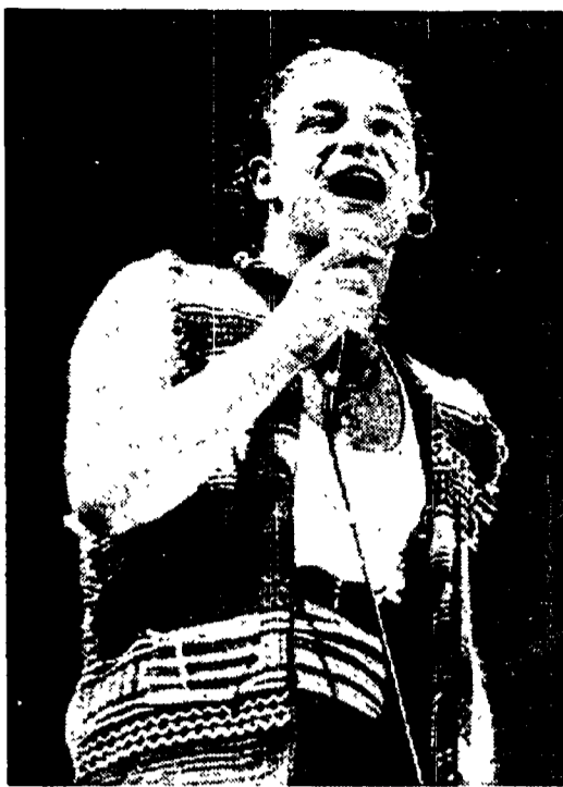
Bono degli U2 stasera a «Notte rock»

Andrà in onda a ottobre «La Roma dei Cesari» documentario in 15 puntate all'interno di «Uno Mattina»