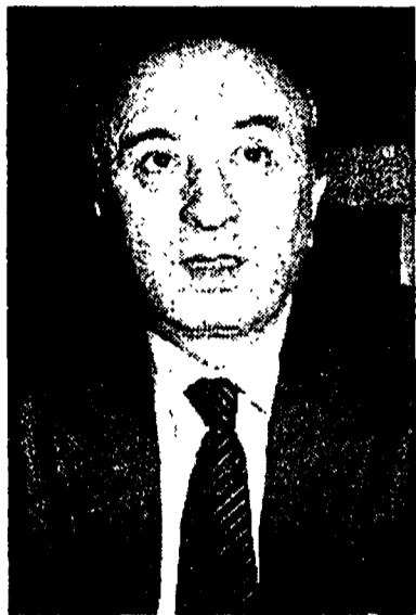
Ciriaco De Mita

De Mita no, non poteva mancare. Gli interlocutori diventano alcuni giornalisti presenti (di Repubblica, del Corriere della Sera, della Stampa e de l'Unità, oltre al moderatore Pasquale Nonno del Mattino).