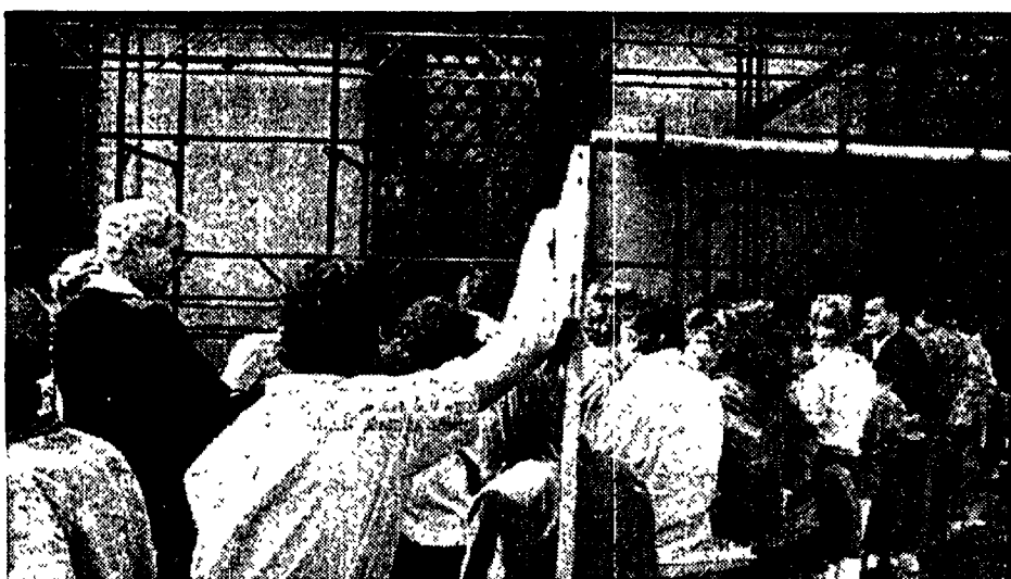
File tra le impalcature, in attesa del turno per entrare nella galleria Borghese, dove le visite sono «scaglionate»

mappe delle condizioni dei musei di Roma e provincia, illustrata ieri dalla Cgil funzione pubblica, appanna l'immagine di Roma capitale della cultura.