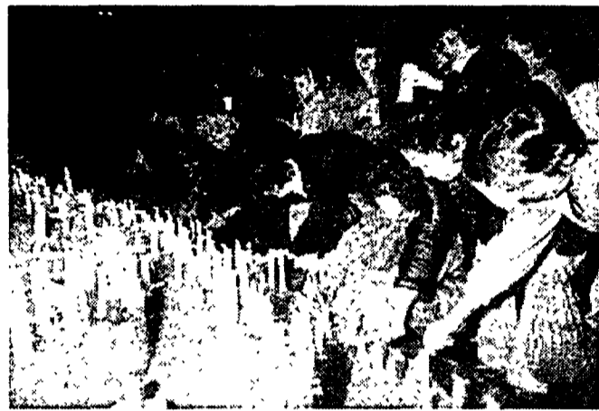
Una manifestazione a Lipsia davanti all'ex-quarter generale della Stasi, la polizia segreta della Rdt