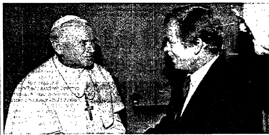
Il presidente cecoslovacco, Vaclav Havel ricevuto dal Papa a Castelgandolfo