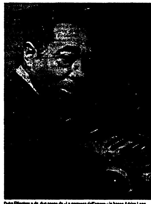
Duke Ellington; a dx. due scene da «La sorpresa dell'amore», in basso Adrian Legg