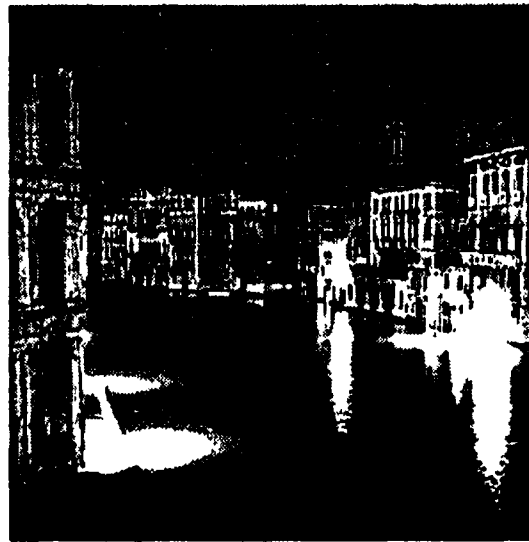
Una veduta del Canal Grande a Venezia

Salvare Venezia. Come? Massimo Riva, presidente dei senatori della Sinistra indipendente, ha una formula. Una Spa («Nuova Serenissima») a capitale pubblico che accenti tutti i poteri e tutti i finanziamenti.