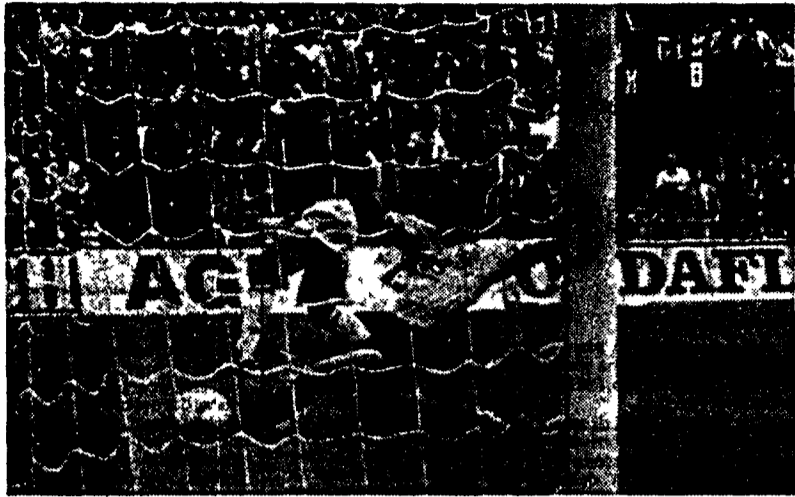
Van Basten dopo essere scattato scarta anche il portiere sardo Ielpo e scarica la palla in rete; nelle altre immagini ancora i centravanti rossoneri protagonisti nell'area cagliarita; segnerà anche la seconda rete su rigore

Come ai vecchi tempi: avvio travolgente, pressing a tutto campo e agilità in ogni azione. Subito il gol di Van Basten nato da un errore della difesa: raddoppia l'olandese su rigore. Esce Maldini per stiramento entra Costacurta, poi si rivede Rijkaard dopo un'assenza di cinque mesi