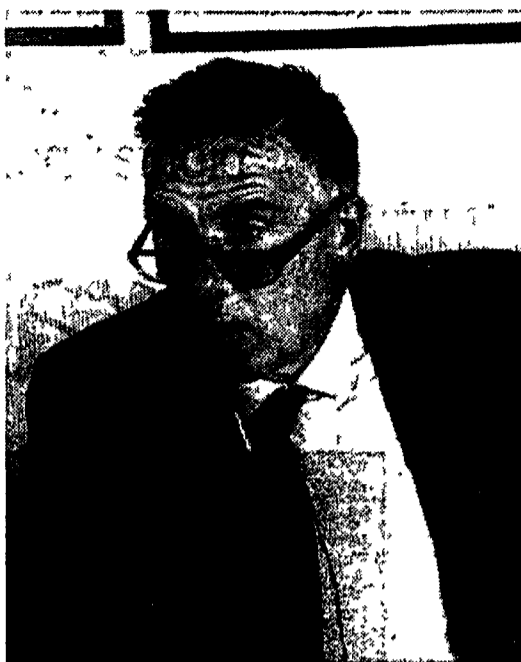
Il segretario generale della Cgil, Bruno Trentin