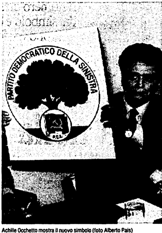
Achille Occhetto mostra il nuovo simbolo