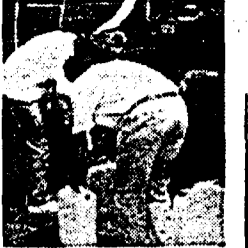
A Cagliari l'acqua non è potabile