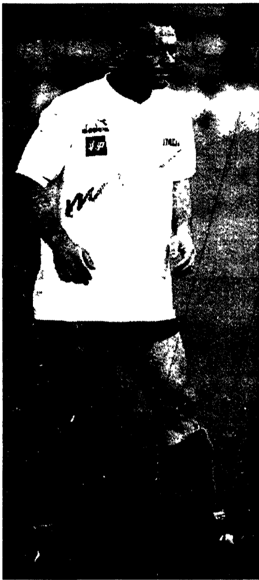
Totò Schillaci atteso stasera ad una grande prova sull'erba dello stadio di Budapest...