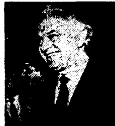
Shevardnadze e Dumas «Speriamo che Saddam ci ripensi»