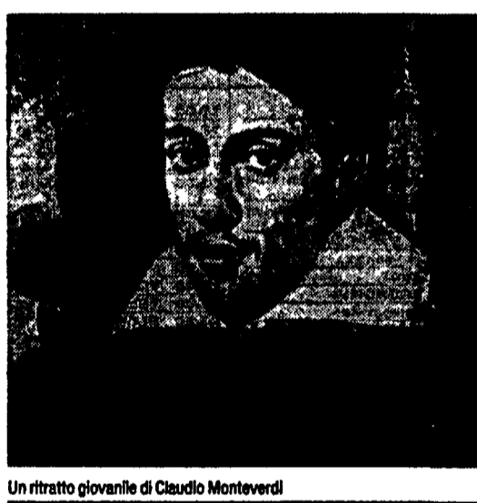
Un ritratto giovanile di Claudio Monteverdi

ROMA. «A Capetown, dove sono nato, vivevamo nei ghetti, in una capanna coi muri fatti di carta, l'acqua che entrava dal tetto quando pioveva, il bagno fuori, in una specie di stanzino messo su con poche assi di legno».