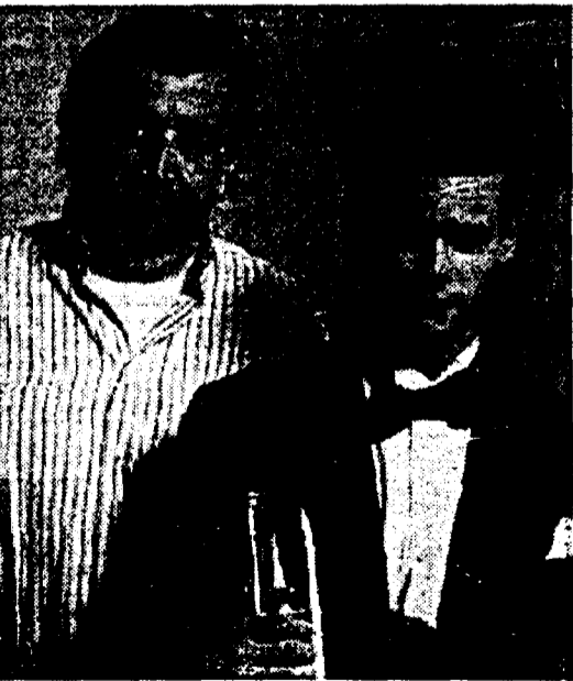
Pupi Avati insieme al giovane attore americano che interpreta Bix

PAVAROTTI TERRÀ I CONCERTI IN MESSICO. Il celebre tenore Luciano Pavarotti ha confermato la sua presenza in Messico per due concerti che si terranno il 24 e il 28 novembre prossimi.