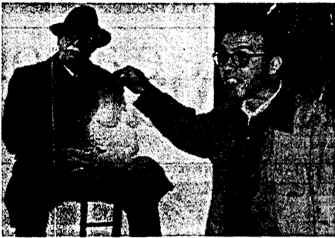
Giuseppe Tornatore al Mifed di Milano di fronte al cartellone pubblicitario del film «Stanno tutti bene» interpretato da Marcello Mastroianni