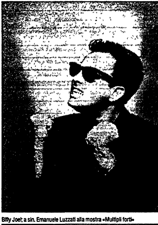
Billy Joel; a sin. Emanuele Luzzati alla mostra «Multipli forti»