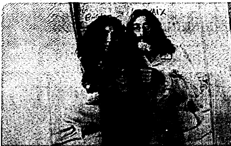
Yoko Ono a «Let's have a dream», la mostra dedicata a John Lennon

completa retrospettiva che sia stata realizzata delle opere di Lennon: Ma è solo una delle tante iniziative celebratorie intraprese dalla vedova; il 21 e 22 dicembre ci sarà un concerto.