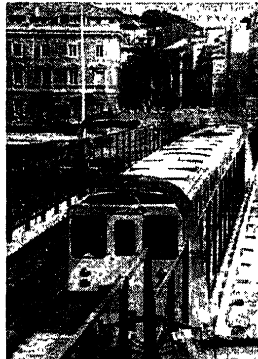
Ancora disagi per i pendolari domani pomeriggio si fermano per uno sciopero dei macchinisti le metropolitane «A» e «B»

Una città assediata dai divieti, dalle limitazioni del traffico pesantissimo. Un'onda lunga, quella dell'emergenza trasporti, che proseguirà anche domani