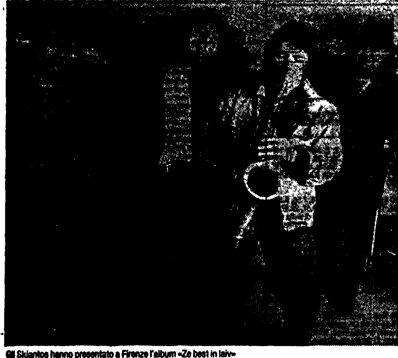
Gli Skiantos hanno presentato a Firenze l'album «Ze best in la»

«Un iliride degli indipendenti che non nascono manager è che prima si pongono il problema di fare i dischi e poi quello di gestirli, distribuirli, promozionarli e così via».