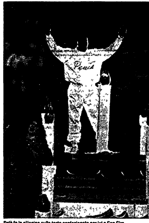
Pelè fa la ciliegina sulla torta confezionata per lui a San Siro

Bruno Giordano ha compiuto 134, ma ad Ascoli sono convinti che non abbia affatto smarrito lo smalto e la rapidità che ne hanno fatto uno dei bomber più apprezzati degli anni 80... «Probabilmente non riuscirete ad indovinare la formazione che affronterà l'Unione Sovietica...»