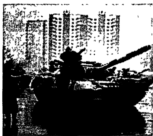
Un soldato sovietico osserva un carro armato alle prove della parata