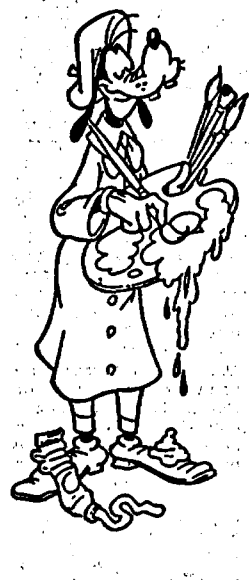
Pippo, presto su Raiuno

crati, Nothing is shocking, di due anni fa, ed il recente Ritual de Habitudo.