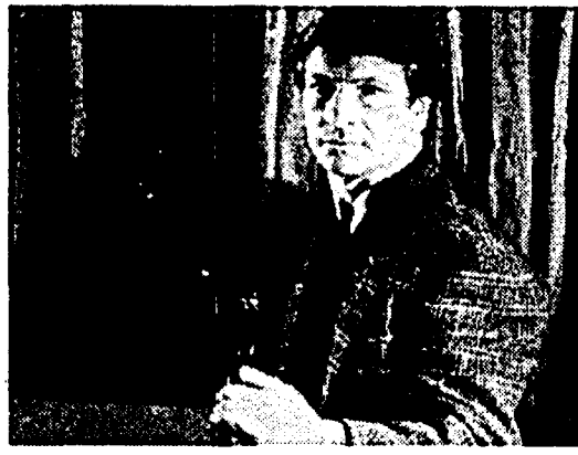
«La Piovra», vincitrice della settimana Auditel (a destra il grafico con i dati delle reti dal 29 ottobre al 4 novembre)