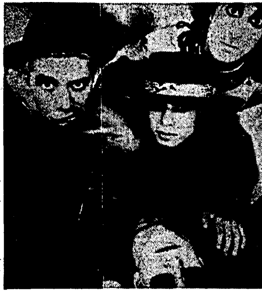
Stasera Videomusic trasmetterà un concerto dei Jane's Addiction

ma certamente nuovo in Italia. E aggiunge: «È un sistema molto suggestivo, che sembra assicurare al cliente la possibilità di ottimizzare il suo investimento mirando giusto al cuore del suo pubblico».