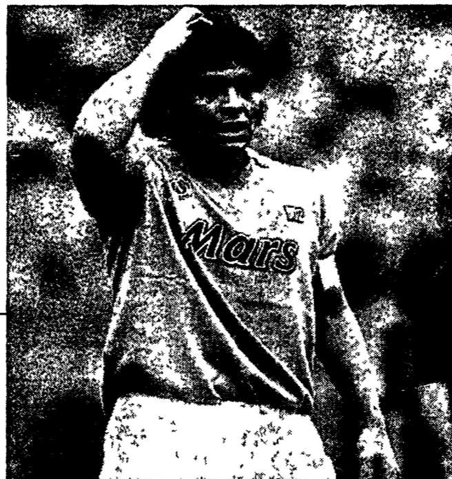
Diego Armando Maradona 30 anni ancora una volta nell'occhio del ciclone, ieri non si è presentato all'allenamento del Napoli