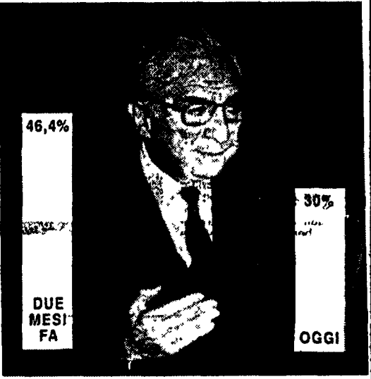
La popolarità di Cossiga è calata dal 46,4 al 30%