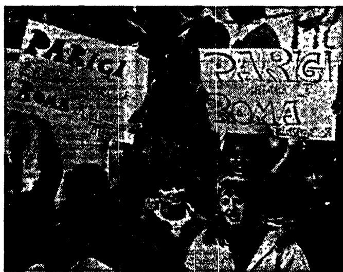
Immagine della manifestazione studentesca di ieri

Dalle scuole della periferia romana, giovanissimi e in forme spontanee, hanno invaso le vie del centro. I 15 mila studenti sono scesi in piazza per chiedere più aule e laboratori. Dopo il corteo, che da piazza della Repubblica è arrivato fino a via IV Novembre, c'è stata un'assemblea alla quale ha parlato una studentessa francese. Applausi agli immigrati della Pantanella e fischi all'assessore Lovari.