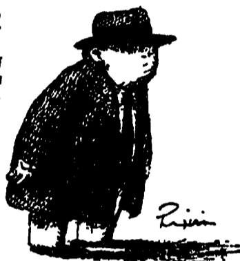
I GLADIATORI SONO COME TUTTI GLI ALTRI UMANI

(*) quotidiano del Padi editoriale di prima pagina siglato U.