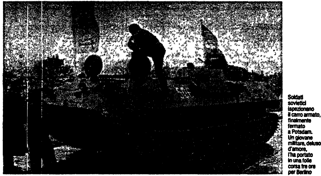
Soldati sovietici ispezionano il carro armato, finalmente fermato a Potsdam. Un giovane militare, deluso d'amore, l'ha portato in una folle corsa tre ore per Berlino