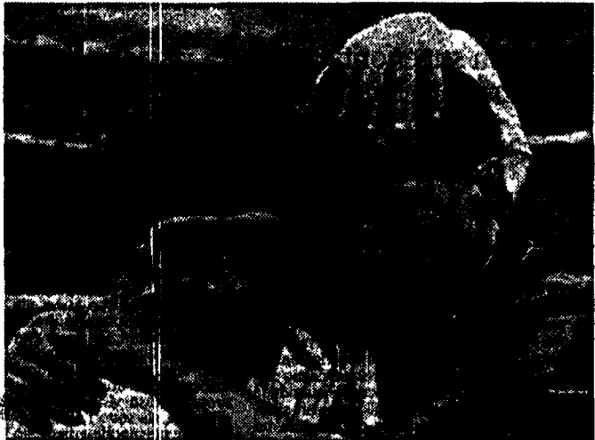
Maradona confortato da Matthaeus al termine della partita