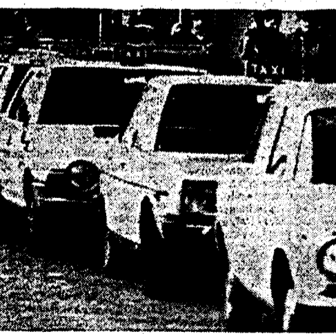
Tassisti in coda alla stazione Termini

Dure reazioni all'agitazione dei tassisti aderenti al sindacato autonomo Sit che a partire dal 6 dicembre hanno deciso di aumentare autonomamente le tariffe delle auto gialle in polemica con il Campidoglio.