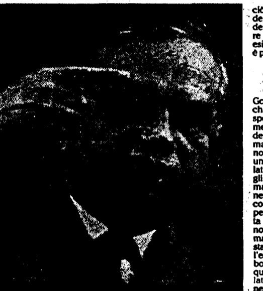
Vladimir Ivashko, vicesegretario generale del Pcus...

Intervista a Vladimir Ivashko vicesegretario generale del Pcus. «La situazione in Urss è pericolosa»