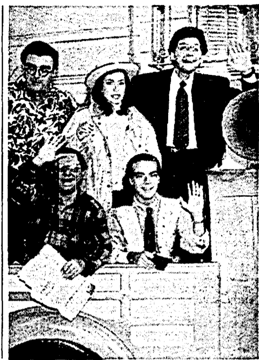
Fabrizio Frizzi insieme ai cast di «Fatti vostri»

tà, vediamo introdotto il canale informativo all news , - prosegue Menduni - proposto dal convegno del Pci e per il quale si è molto battuta l'Usigrail. Tutto bene, dunque? I punti deboli rimangono: la cattiva qualità degli impianti tecnici e i pochi soldi per i programmi. Per questo il lavoro fin qui compiuto è solo parziale. Vedremo nel nuovo bilancio se tutti i nuovi amici della radio sono veri amici, e intendono veramente darci i mezzi per diventare efficaci e produttivi». Il mezzo radiofonico - ha detto Marco Follini, consigliere Dc - è sempre stato in primo piano nelle nostre parole, ma qualche volta in secondo piano nelle nostre decisioni strategiche. Il rafforzamento della radio può offrire un contributo determinante da tutta l'azienda Rai. «Il Pci si è impegnato da tempo attorno al tema della radio - commenta Vincenzo Vita, responsabile per il Pci delle comunicazioni di massa - con iniziative e proposte che sono state parzialmente accolte. È essenziale che l'attenzione non venga ora meno e che possiamo seguire ulteriori passi concreti». □ E.M.