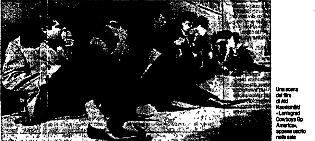
Una scena del film di Aki Kaurismäki «Leningrad Cowboys Go America»...