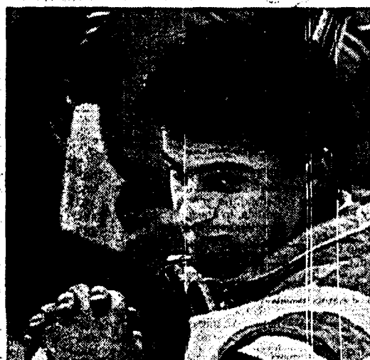
Alberto Tomba ha fatto subito cilecca