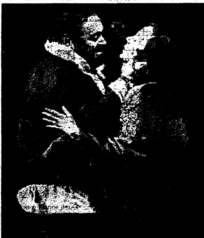
Luciano Pavarotti e Raina Kabaivanska durante le prove della «Tosca» che inaugurerà la stagione all'Opera di Roma

I costumi di Piero Tosi, realizzati dal sartoria dell'Opera, vengono elogiati da Raina Kabaivanska, cui piace anche la tradizionale «Tosca» stile Liberty, ma è pronta ad aderire ad una nuova visione del personaggio. Elogia, appunto, i costumi che evocano Tosca alla figura di una vendicativa Medea. Ce l'ha un po' con Puc-