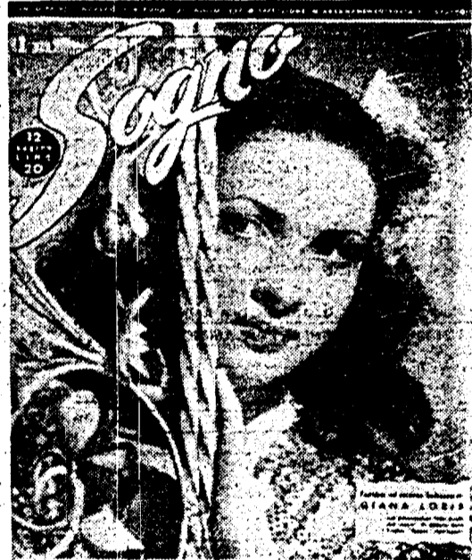
SETTIMANALE DI ROMANZI D'AMORE A FOTOGRAFIA