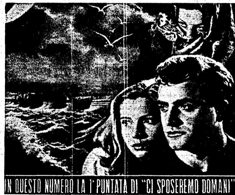
IN QUESTO NUMERO LA 1 PUNTATA DI "CI SPOSEREMO DOMANI"