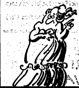
UN GENIO DELLA MEDICRITA'!