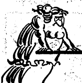
PERCHE' SEI TUTTO CIO CHE OGNI ITALIANO SOGNA DI ESSERE...