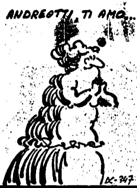
ANDREOTTI, TI AMO!