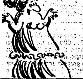
... HA TU SOLO PUGIL!