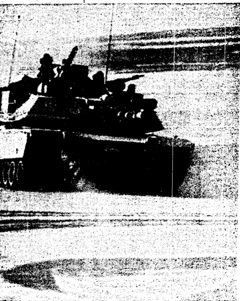
Un carro armato americano tra le dune del deserto impegnato in una operazione alla vigilia della scadenza dell'ultimatum al regime di Bag

La guerra, concordano tutti gli esperti, difficilmente potrà essere vinta senza muovere le forze di terra. Ed è in questo settore che gli irakeni sono più forti. Contro i 3800 carri armati alleati, tra cui i nuovi e sofisticati Abrams M1A1 americani, l'Irak schiera nel complesso 4000 carri armati operativi di cui ben 1000 sono moderni T-72 di fabbricazione sovietica. Inoltre l'esercito irakeno ha vissuto la tragica ma, da un punto di vista militare, preziosa esperienza di una guerra di trincea durata 8 anni con l'Iran. Ha avuto modo e tempo di scavare trincee e costruire strade in Kuwait. La conquista dell'Emirato potrebbe rivelarsi lenta e costosissima in termini di vite umane. Al Pentagono i computer hanno previsto almeno 16mila morti americani e 200 o 300mila irakeni nel corso della campagna del Kuwait.