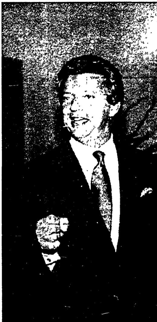
Vittorio Cecchi Gori, presidente di Tele + 1

ra, sul costo piuttosto alto del noleggio. Ma Giovanni risponde a tutto. E ha dalla sua l'esempio francese, quello di Canal Plus, che in pochi anni è diventata un affarone, con tre milioni di sottoscrizioni che la mettono in grado di sostenere il 90% della produzione cinematografica nazionale.