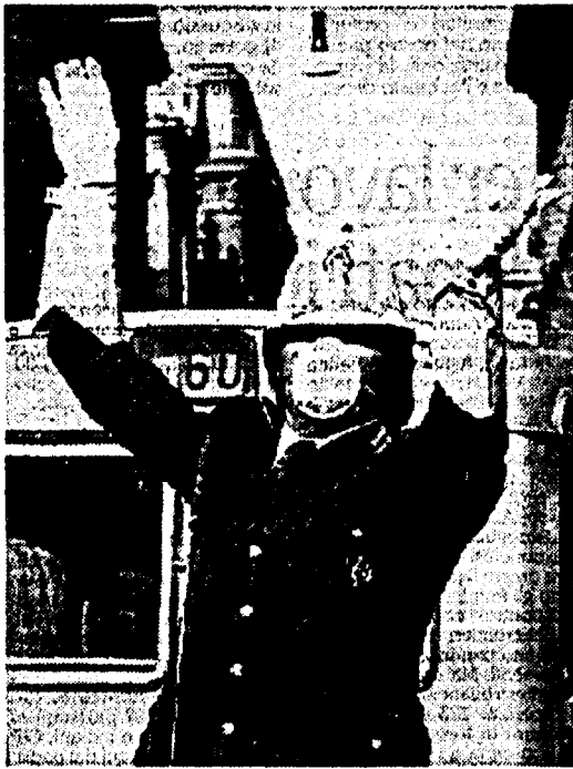
Vigilia con mascherina antismog. In alto la centralina di largo Argentina