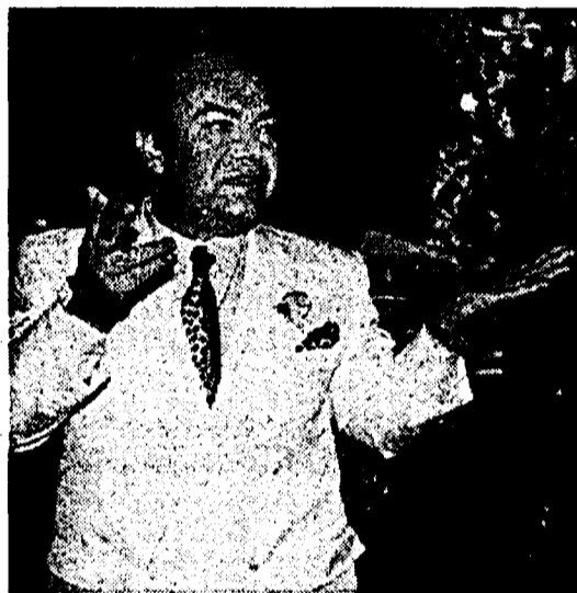
Lino Banfi conduce «Una sera ci incontrammo» su Canale 5

Lino Banfi, con Rosanna Banfi e Corrado Tedeschi, conducono stasera lo Speciale di San Valentino «Una sera ci incontrammo», su Canale 5 (ore 20.30). Il comico pugliese, impegnatissimo sia con la Rai che con la Fininvest, ha in programma varietà e telefilm, spot e sit-com. Ha anche proposto di portare uno spettacolo nel Golfo per le truppe. Ma finora Andreotti ha detto di no.