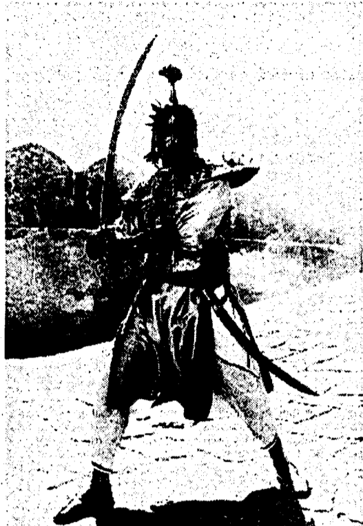
Kabir Bedi nei panni di Kammamuri

Parla Kabir Bedi, protagonista dei «Misteri della giungla nera»