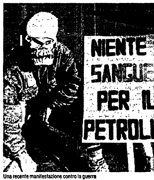
Una recente manifestazione contro la guerra

Sono in circolazione quattro spot, ironici e suggestivi, che invitano all'obiezione di coscienza.