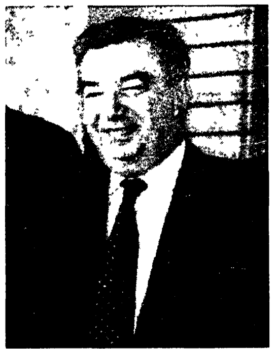
Evgheny Primakov l'invitato speciale di Gorbaciov