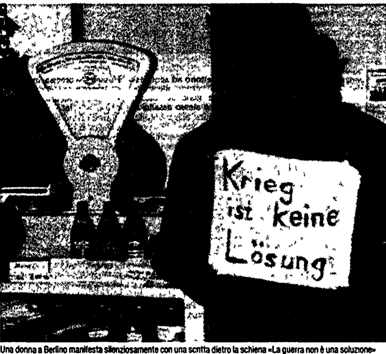
Una donna a Berlino manifesta silenziosamente con una scritta dietro la schiena «La guerra non è una soluzione»