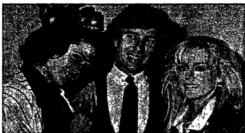
Tre protagonisti del numeroso cast di «Capitol»

gatoria», se continua a guardare anche se non vede l'ora che finiscano, che arrivino all'ultima puntata. E anche l'abitudine creata dall'orario e dalla collocazione quotidiana a dare al telespettatore una «sicurezza» che crea affezione. La stessa ragione che ha portato alle fortune di Beautiful: «Anche se forse Capitol aveva maggiori ambizioni, raccontava una storia di potere, lo scontro per la conquista della Casa Bianca. Beautiful è la solita soap».