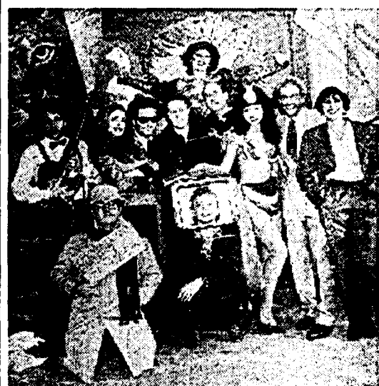
Il cast di «Avanzi» da stasera su Raitre

non accettò di finanziare le nostre proposte e ci ritrovammo tutti a spasso. Mi buttai quindi a corpo morto sulla televisione. Da allora ho lavorato con Anton Giulio Majano, Tio Schirini, Enzo Trapani e, alla radio, in molte produzioni tra le quali La nonna del corsaro nero. L'ultima esperienza in Rai è stata Fresco fresco, un contenitore estivo in diretta, poi sono stato ingaggiato dalla Fininvest e là ho condotto il primo programma mattutino della storia della televisione, Buongiorno Italia. Da allora, era il 1981, ho sempre lavorato per Berlusconi.