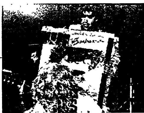
Visto da noi giovani

Seconda giornata in leggera salita con uno spassoso Marco Carena L'Auditel rincuora gli organizzatori Stasera i vincitori fra i giovani