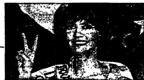
Visto in poltrona